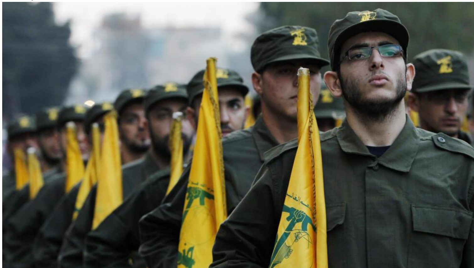
Ảnh minh họa: Chiến binh Hezbollah trong một cuộc diễu hành ở Beyruth, Liban, ngày 12/11/2010.

Vào lúc Israel chuẩn bị mở cuộc tấn công vào dải Gaza, mọi ánh mắt lo lắng hướng về Liban. Các cuộc đụng độ ở biên giới phía bắc Israel với Liban làm dấy lên nỗi lo ngại mặt trận thứ hai sẽ nổ ra. Một kết quả có nguy cơ dẫn đến một cuộc chiến tranh toàn diện trong khu vực.