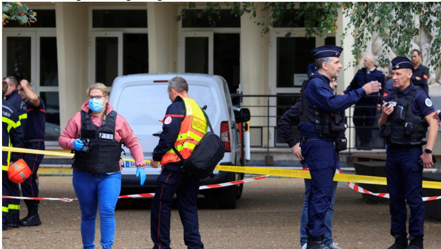
Cảnh sát tại trường trung học Gambetta-Carnot ở Arras, Pháp, sau vụ khủng bố ngày 13/10/2023.

Một vụ tấn công khủng bố vừa xảy ra vào sáng nay, 13/10/2023, tại một trường trung học ở thành phố Arras ( vùng Pas-de-Calais ). Kẻ khủng bố, một thanh niên 20 tuổi người Nga gốc Tchetchenia, đã cầm dao xông vào trường vào lúc khoảng 11 giờ, đâm chết một giáo viên và đâm trọng thương 2 người, theo tin của bộ Nội Vụ.