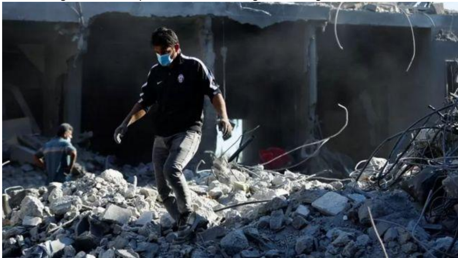
Nga tuyên bố sẽ đóng vai trò giải quyết xung đột

Ngoài ra, việc nói rằng bạn "có thể và sẽ đóng một vai trò" trong việc đạt được hòa bình không đảm bảo rằng những người liên quan đến cuộc xung đột sẽ chấp nhận bạn làm người hòa giải.