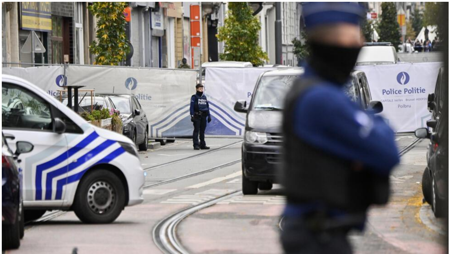
Cảnh sát đứng gác tại khu vực Schaerbeek, Bruxelles, nơi nghi phạm bị bắn chết, ngày 17/10/2023.

Nguồn tin của cảnh sát cũng đã xác nhận thông tin nghi phạm, một người gốc Tunisia, đã bị bắn chết tại khu phố Schaerbeek.