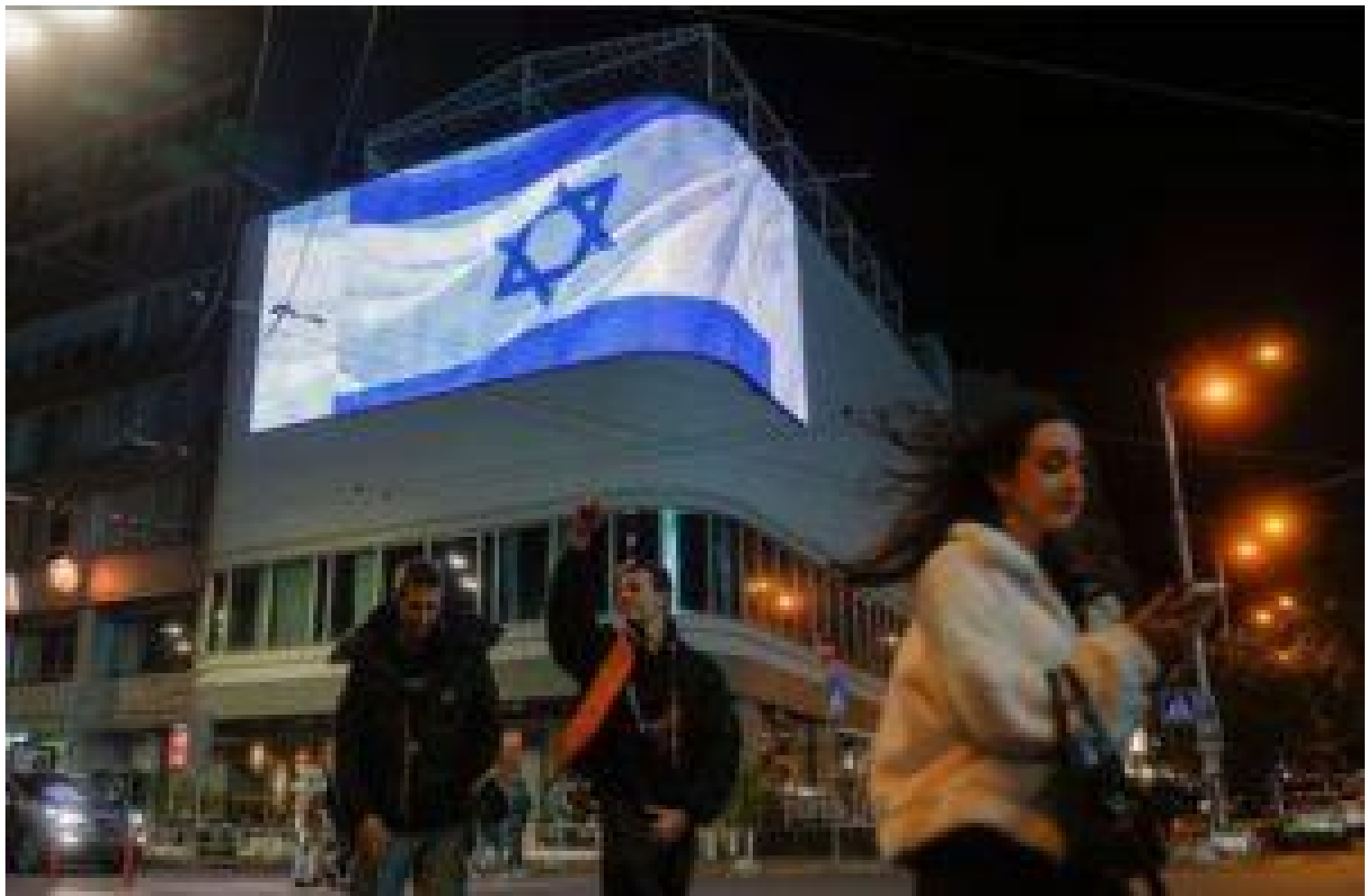
Ảnh: Người dân đi ngang qua một màn hình khổng lồ hiển thị quốc kỳ Israel trên một con phố ở trung tâm thành phố Kyiv, Ukraine, hôm thứ Bảy.

Trong hơn một năm rưỡi, cuộc chiến ở Ukraine thu hút sự chú ý của toàn cầu với những cảnh tượng đẫm máu sau cuộc xâm lược của Nga. Nhưng các cuộc tấn công gây sốc hôm thứ Bảy ở Israel, do nhóm Hamas của Palestine lãnh đạo, và một cuộc chiến sắp xảy ra ở Dải Gaza do Israel trả đũa, có vẻ như sẽ làm thay đổi chiến trường cho cả Kiev và Matxcova.